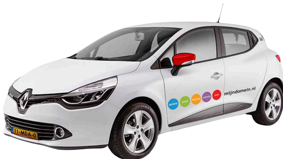
Afbeelding 5 - Renault Clio voorzien van Mijndomein.nl reclame

Standaard autoleaseproducten zijn niet transparant. Zo geven de meeste autoleasecontracten ruimschoots gelegenheid aan de leasemaatschappij om tussentijds de tarieven te verhogen, bijvoorbeeld bij afwijkende kilometrages of door een jaarlijkse aanpassing van het verzekeringstarief. Het autoverhuurproduct van Mijndomein.nl Offline B.V. daarentegen bevat geen verborgen kosten en kan alleen worden aangepast als gevolg van overheidsmaatregelen. Het all-in tarief is vast gedurende de looptijd. Meerkilometers hebben een vaste prijs en het verzekeringstarief wordt niet aangepast. Daarnaast weet een huurder van tevoren wat de boetes voor schade en voortijdige beëindiging van de huur zijn.