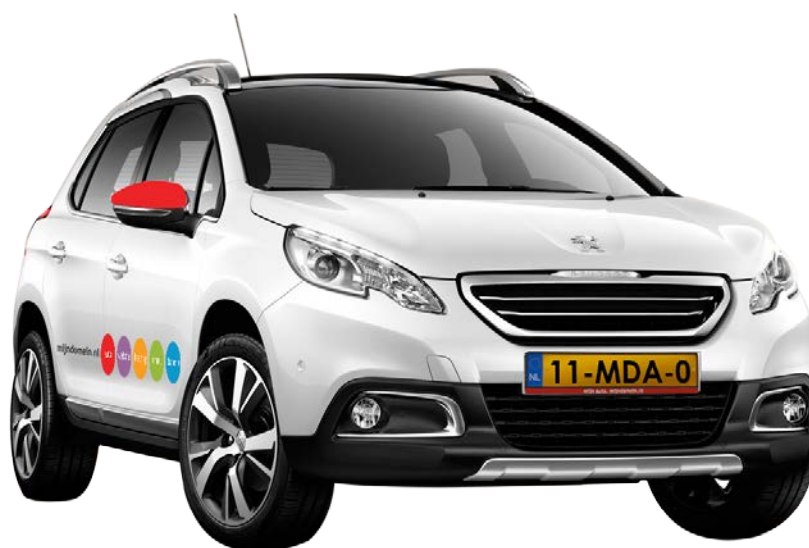
Afbeelding 2 - Peugeot 2008 voorzien van Mijndomein.nl reclame

Prijsvergelijkingen laten zien dat door o.a. reclame-inkomsten en een verregaande automatiseringsgraad Mijndomein.nl Offline B.V. de auto's kan verhuren voor prijzen die in het algemeen lager liggen dan die voor particuliere of zakelijke lease. Ook door haar kernwaarden "Eerlijk, Eenvoudig en Eigenwijs" wil Mijndomein.nl Offline B.V. zich ten behoeve van haar klanten in gunstige zin te onderscheiden van de concurrentie. Via de huur- en reclame-inkomsten worden de financierings- en andere kosten gedekt. In de huur zijn alle kosten inbegrepen, zoals de kosten voor WA-Cascoverzekering, onderhoud en wegenbelasting. Alleen de brandstofkosten zijn voor rekening van de huurder. Voor meer informatie over de autoverhuur wordt verwezen naar www.mijndomein.nl/auto .