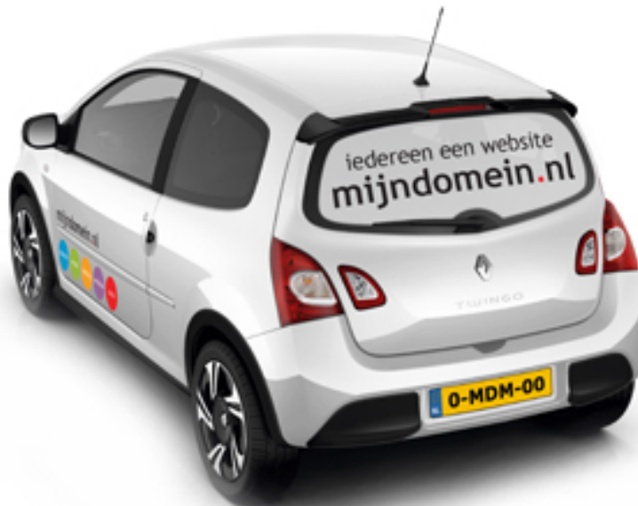
Afbeelding 3 - Renault Twingo voorzien van Mijndomein.nl reclame