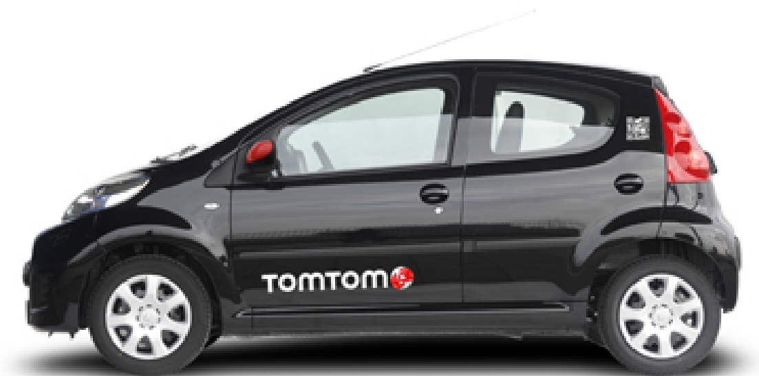
Afbeelding 4 - Peugeot 107 XS voorzien van TomTom reclame

De Uitgevende Instelling streeft ernaar eind 2015 een portefeuille van meer dan 2.000 verhuurde auto's te hebben.